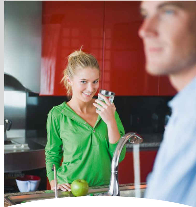
NACHRÜSTBARER SYSTEMTRENNER BA295D-¾WH

Sind Sie wirklich sicher? Trennen Sie zuverlässig Ihr Trinkwasser von Nichttrinkwasser