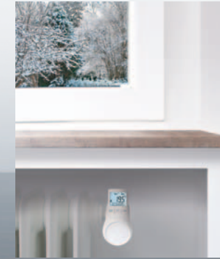
Auch in schwierigen räumlichen Situationen gut ablesbar.