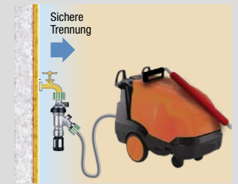
Normgerechter Anschluss eines Hochdruckreinigers.