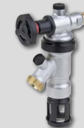
Alternativ: Der BA295D-½ASC mit integriertem Zapfhahn (innen > 0°C).