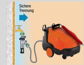
Normgerechter Anschluss eines Hochdruckreinigers.