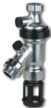
BA295D-¾WH zur Absicherung von angeschlossenen Geräten