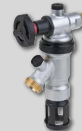
Alternativ: Der BA295D-1½ASC mit integriertem Zapfhahn (Innen > 0°C).